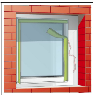
1. Bild: TP601 mit der Selbstklebung am Fensterrahmen fixieren.