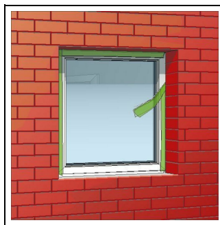
2. Bild: Zum gewünschten Zeitpunkt TP601 durch Abtrennen von Folie und Faden aktivieren.